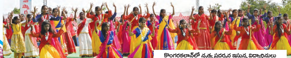
కొంగరకలానలో నృత్య ప్రదర్శన ఇస్తున్న విద్యార్థినులు

(రంగారెడ్డి/వికారాబాద్/మేడ్చల్-ప్రభాతవార్త) తెలంగాణ రాష్ట్ర అవతరణ దినోత్సవ వేడుకలు రంగారెడ్డి, మేడ్చల్, వికారాబాద్ జిల్లా కేంద్రాలలో అత్యంత వైభవంగా జరిగాయి. రంగారెడ్డి జిల్లా కొంగరకలానలోని సమీప కట్టె కార్యాలయాల సముదాయంలో రాష్ట్ర ఐటీ, పరిశ్రమల శాఖ మంత్రి, జిల్లా