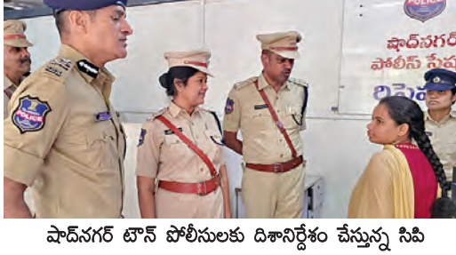
ఘాన్ గర్ బోస్ పోలీసులకు దిశానిర్దేశం చేస్తున్న సిఐ

ఘాన్ గర్ బోస్ పోలీసులకు దిశానిర్దేశం చేస్తున్న సిఐ ఘాన్ గర్ బోస్ పోలీసులకు దిశానిర్దేశం చేస్తున్న సిఐ నిరంతర సంబంధాలు కొనసాగించాలని సూచించారు. గ్రామ పోలీసు అధికారులు (వీవీఓలు) గ్రామాల్లో సమాచార సేకరణను ముమ్మరం చేసి అనుమానాస్పద కదలికలు, కార్యకలాపాలపై వెంటనే సమాచారం అందించాలని