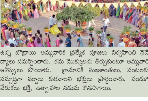
ఉన్న బోనాలు అమ్మవారికి ప్రత్యేక పూజలు నిర్వహించి నైవేద్యాలు సమర్పించారు. తమ మొక్కులను తీర్చుకుంటూ అమ్మవారి ఆశీర్వాదాలు పొందారు. గ్రామానికి సుఖశాంతిలు, పంటలకు సమృద్ధిగా వర్షాలు కరవాలని భక్తులు ప్రార్థించారు. పండుగ వేడుకలు భక్తి, ఉత్సాహాల సదుపాయం కొనసాగాయి.