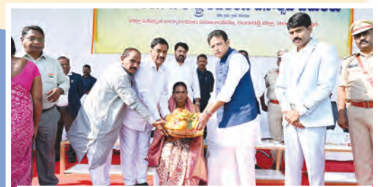
రంగారెడ్డిలో అమరవీరుల కుటుంబ సభ్యులను సత్కరిస్తున్న మంత్రి శ్రీధర్ బాబు

స్మరించుకున్నారు. ఉద్యమ వీరుల ఆత్మగాలు పునాదులపైనే తెలంగాణ రాష్ట్రం ఏర్పడిందని, వారి సేవలు చిరస్మరణీయుమని కొనియాడారు. రాష్ట్ర అవతరణ దినోత్సవాన్ని పురస్కరించుకుని వివిధ ప్రభుత్వ శాఖలు ఏర్పాటు చేసిన ప్రదర్శన స్టాల్స్ ను మంత్రి సందర్శించి, ప్రజలకు అందిస్తున్న సేవలు, సంక్షేమ పథకాల అమలు తీరుపై అధికారులను అడిగి తెలుసుకున్నారు. ఇక్కడ జరిగిన తెలంగాణ ఆవిర్భావ వేడుకలు ఉద్యమ స్ఫూర్తిని, సాంస్కృతిక వైభవాన్ని